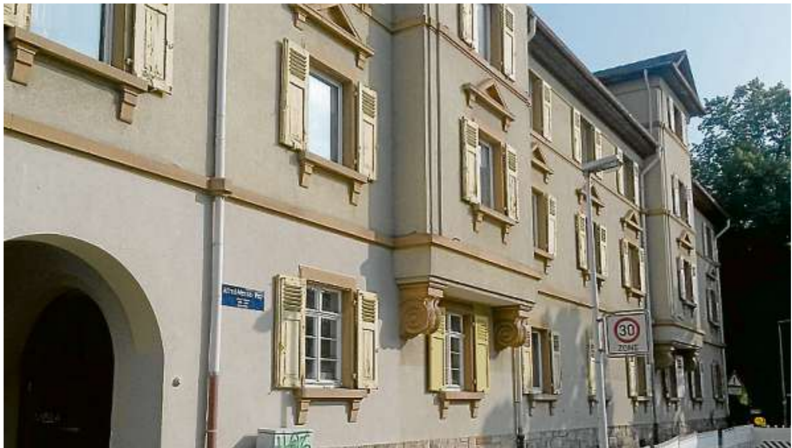
Diverse Liegenschaften im Darmstädter Spessarting haben eine Modernisierung erhalten. Eine Verbesserung für die Mieter sieht Kevin Bettin dadurch nicht. Trotzdem befürchtet er steigende Preise.